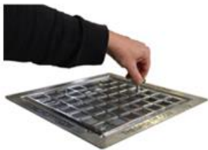
1. Draai met de sleutel het slot open