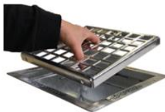
2. Neem het rooster uit