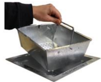
3. Neem met behulp van het handvat de binnenbak uit